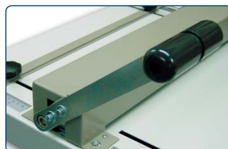
Wygodny uchwyt dźwigni bigującej