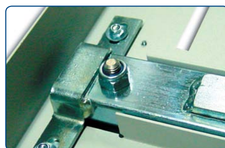
Możliwość regulacji siły bigowania